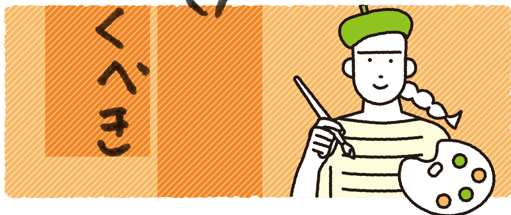
Photo grapher + WEB Marketing